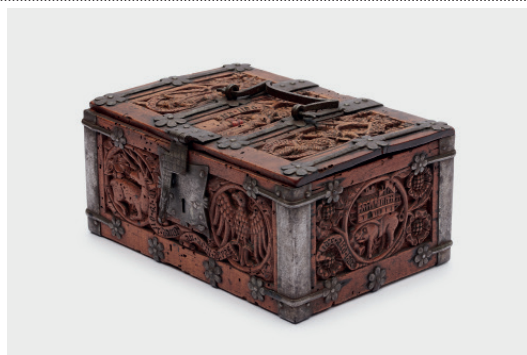
Minnekästchen, Inv. Nr. A1463

Donnerstag, 6. April, 19 Uhr, Details siehe Vorderseite