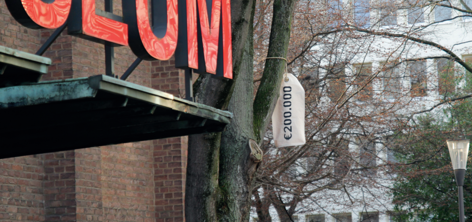
Ausstellungsansicht „Between the Trees“, Installation „Wertewandel“