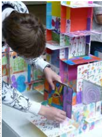
Workshop im MAKK