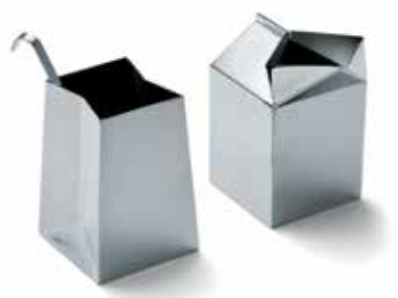
Milch- und Zucker-Set BUTLER

Zum ersten Mal wird das Gesamtwerk des Grafikdesigners und Art Directors Willy Fleckhaus (1925-1983) in einer Ausstellung gewürdigt. Man nannte ihn nicht zufällig den ‚teuersten Bleistift Deutschlands‘. Wie kein Anderer hat Fleckhaus die visuelle Kultur der jungen Bundesrepublik von den 1960ern bis in die 80er hinein geprägt. Die legendäre Regenbogenreihe edition suhrkamp , das Erscheinungsbild des WDR oder die 1959 gegründete Zeitschrift twen , die in Sachen Fotografie, Illustration und Gestaltung bedeutendste deutsche Zeitschrift nach 1945, sind nur einige Beispiele seines umfangreichen Schaffens. Köln spielte mit seiner Kunstszene und besonders der photokina eine wichtige Rolle und wurde zum Sprungbrett für Fleckhaus' nationales wie internationales Wirken. Das MAKK ist somit als Kölner Museum der kongeniale Ort für diese Hommage.