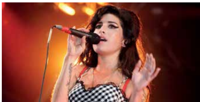
Filmstil! Amy Winehouse in AMY