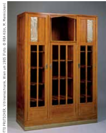
OTTO PRITSCHER, Vitrinenschrank, Wien um 1905

Selbstgemachtes liegt wieder voll im Trend! Daher bietet der Museumsdienst Köln im August zwei tolle Workshops für kleinere und größere Kreative an: Am 3. August können Kinder ab fünf Jahren im Museum die schönsten Mustern entdecken und anschließend eine coole Stofftasche selbst bedrucken und bemalen. Für Kinder ab acht Jahren geht es am 18. August unter dem Motto Schreib mal wieder! um die Gestaltung des eigenen Briefpapiers oder Postkarten-Sets – damit kommt der persönliche Urlaubsgruß bestimmt gut an! Details siehe Vorderseite.