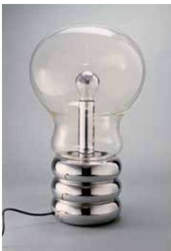
INÉD MAUREE, Tischleuchte „Giant Bulb Clear“, Design: M. München, 1967