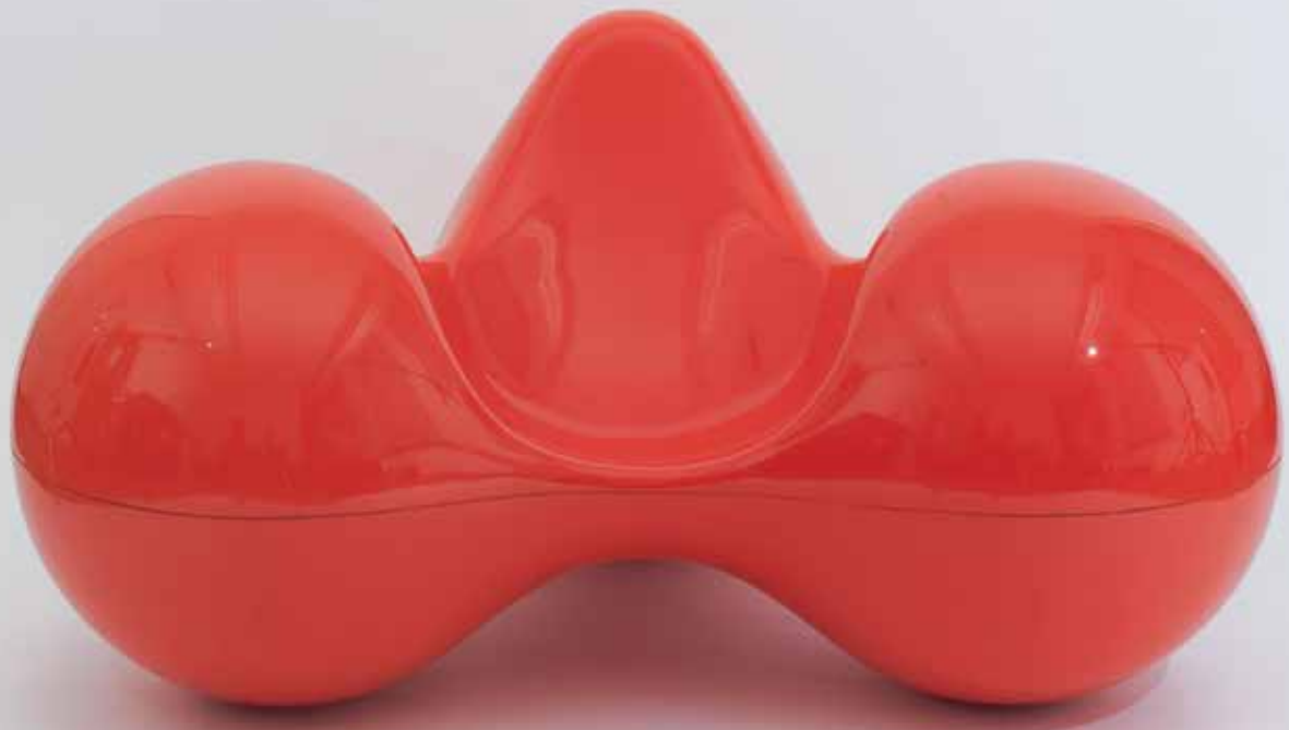
EERO AARNIO, Sitzobjekt „Tomato Chair“, Asko, Lahti, FI, 1971