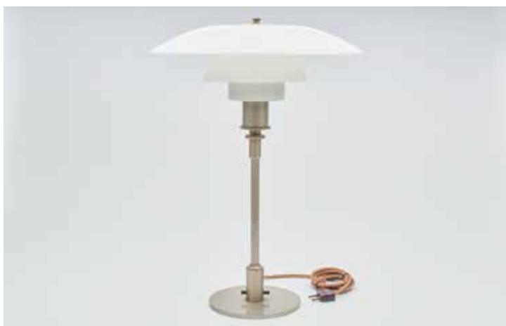
POUL HENNINGSEN, PH-Leuchte, Louis Poulsen, Kopenhagen, 1926, Deutsche PH-Lampengesellschaft, Karlsruhe, ca. 1930