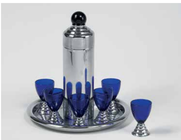
HOWARD F. REICHENBACH, Cocktail Set „Blue Moon“, Waterbury, USA, 1937–1941

Museumsdienst Köln Führung kostenlos, nur Eintritt in die Ausstellung