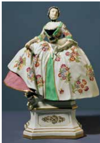
JOHANN JOACHIM KAENDLER, Dame vom Mopsorden, Königliche Porzellanmanufaktur Meissen, 1744