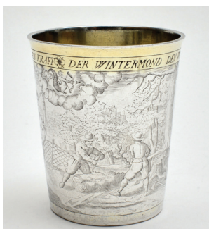
Inv.Nr.: MAKK 2022/77

Die Ausstellungsreihe Ausgewählt ist ein ausdrücklich provisorisches Präsentationsformat, das Aspekte der Historischen Sammlungen des MAKK in den Fokus stellt. Diese umfassen alle Gattungen der Freien und Angewandten Kunst mit einem zeitlichen Schwerpunkt vom Mittelalter bis zum frühen 20. Jahrhundert. Da dieser wichtige und gleichzeitig größte Sammlungskomplex wegen Sanierungen des Museumsbaus längerfristig geschlossen ist, gibt das MAKK bis zur Wiedereröffnung den Besucher*innen regelmäßig Einblicke in die Vielfalt und den Facettenreichtum der Sammlungen und beleuchtet dabei besondere inhaltliche Aspekte. Die hierzu initiierte Ausstellungsreihe ist ein Gemeinschaftsprojekt des mit der Neukonzeption der Historischen Schausammlungen befassten Museumsteams, das derzeit die eigenen Sammlungen intensiv erforscht und neu bewertet. Für die Auftaktausstellung wurde ein ganz persönlicher Zugang gewählt, indem alle sieben Teammitglieder jeweils fünf Objekte ausgewählt haben, die für sie aktuell spannende Aspekte der Sammlungen verdeutlichen, die sie mit den Besucher*innen des MAKK teilen möchten.