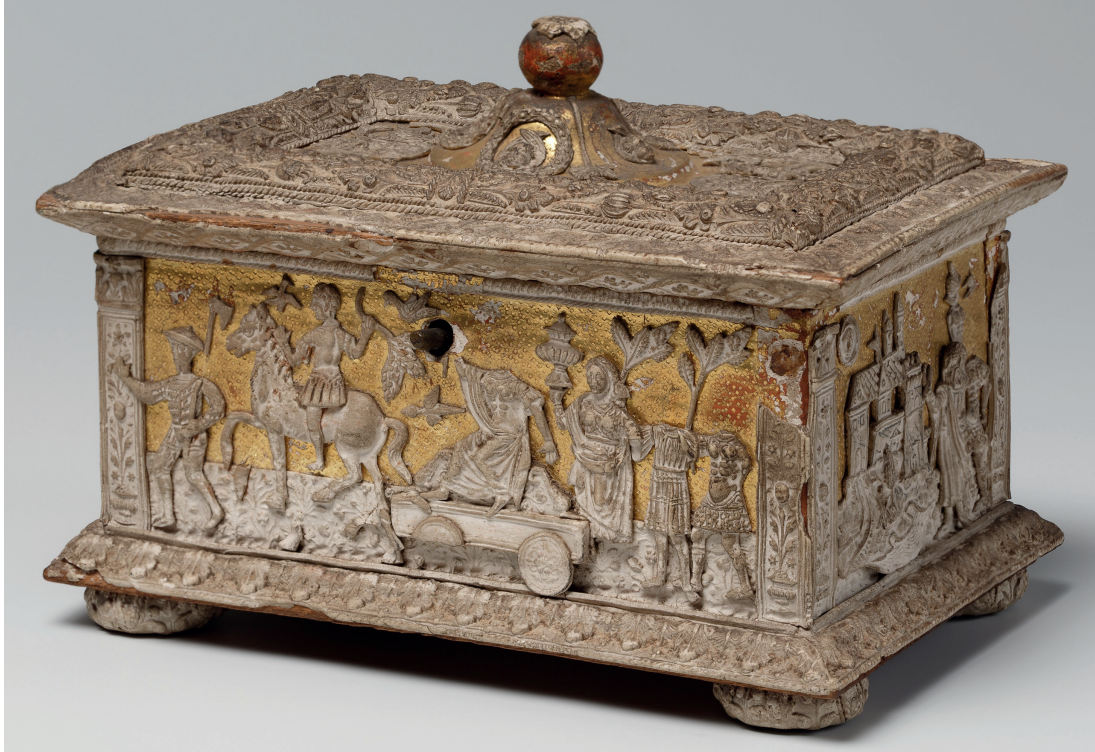
Pastiglia-Kästchen, Italien, Florenz, um 1500, MAKK, Inv.Nr.: A0309