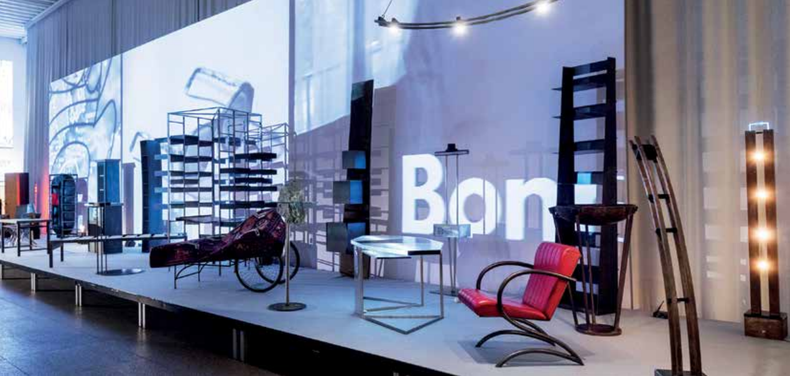
Blick in die Ausstellung DESIGN GRUPPE PENTAGON