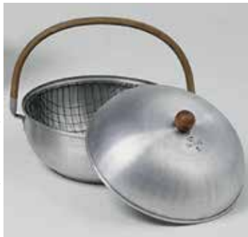
RUSSEL WRIGHT, Brotschneidewärmer, 1930–1933