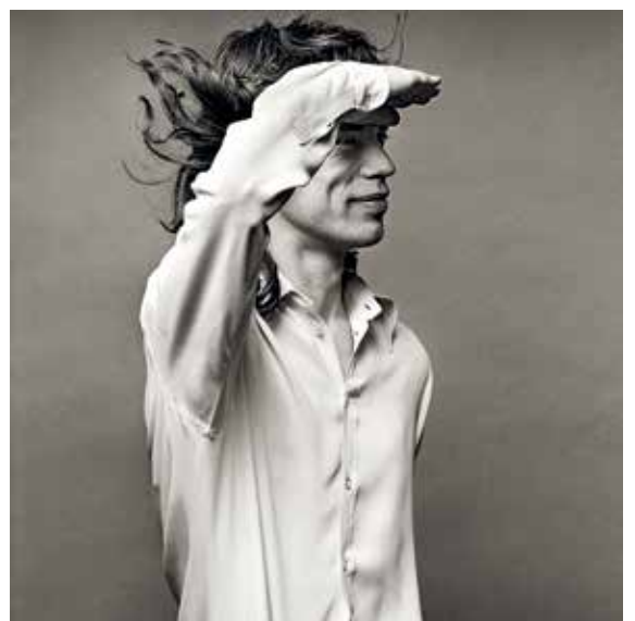
Mick Jagger, 1972

Führung kostenlos, nur Eintritt in die Sonderausstellung