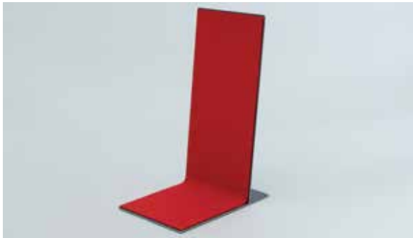
HERMANN BECKER, Sitzmöbel „Rückenlehne“, 1986

Dienstag, 4. Februar, 19 Uhr | um Anmeldung wird gebeten (s. Vorderseite)