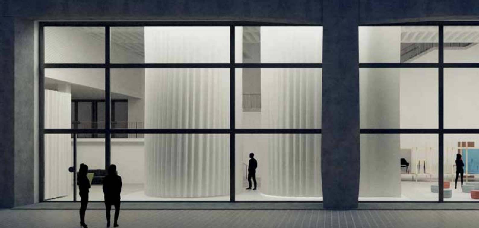
Rendering Ausstellungsgestaltung Stylepark Selected imm 2018 at MAKK