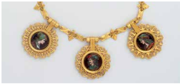
L. FALICE, A. MEYER, Collier mit Porträts der Adelsgeschlechter Foix et Béarn (Detail), 1887

Getreu dem Motto It's not about everything – it's about the best präsentiert Stylepark die interessantesten Neuheiten der imm cologne 2018 in den Räumen des Museums für Angewandte Kunst Köln. Die namhafte Plattform für Architektur und Design zeichnet jährlich von der Stylepark-Redaktion ausgewählte Neuheiten der Möbelmesse aus. Mit der Ausstellung Stylepark Selected imm 2018 at MAKK wird das erfolgreiche Onlineformat erstmals in die 3. Dimension weiterentwickelt: Die prämierten Neuheiten werden in einer spektakulären Szenografie des Münchner Designerduos RelvãoKellermann in der zentralen Ausstellungshalle des Museums präsentiert. Daneben werden Installationen von Studierenden der Hochschule Hildesheim ausgestellt. Beteiligte Unternehmen sind unter anderen Griffwerk, Laufen, Richard Lampert, Loewe, Tsatsas und Vitra.