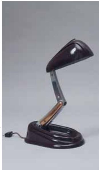
LA SOCIÉTÉ JUMO, Leuchte „Bolle“, Paris, 1945