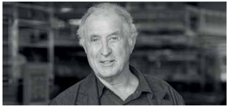
Volkwin Marg