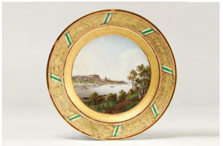
DESSERTTeller MIT ANSICHT VON PIRNA, G. F. Kersting, Meissen, 1818-20