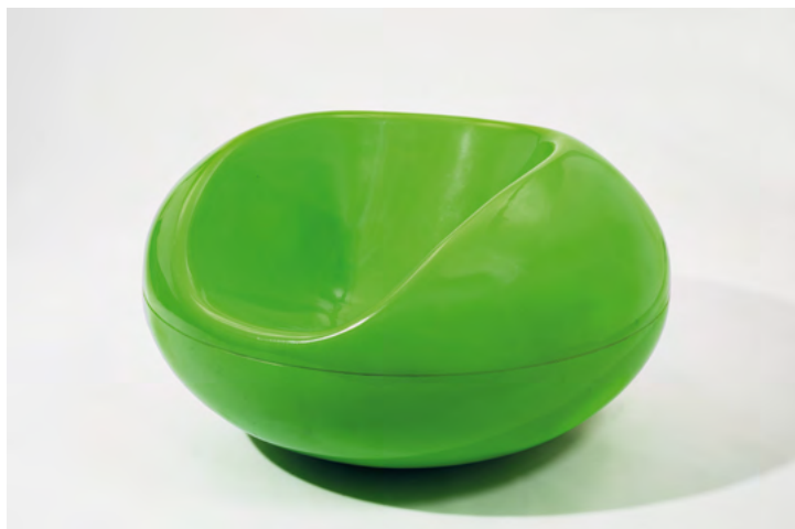
SITZMÖBEL PASTILLI, Eero Aarnio, 1967

FÜHRUNG „Plastic Fantastic“ – Plastik, Kunststoff, Bakelit: neue Materialien des 20. Jahrhunderts Museumsdienst Köln Führung kostenlos, nur Eintritt