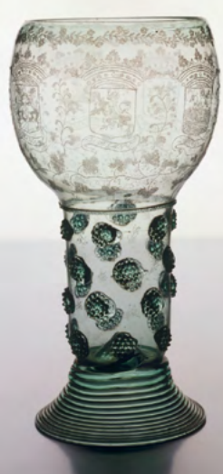
RÖMER, Holland, Letztes Viertel 17. Jh.

Bei einem Römer handelt es sich um ein seit dem 16. Jahrhundert beliebtes Trinkglas, vornehmlich für den Weingenuss. Sein Name leitet sich aus dem niederländischen ‚roemen‘ ab, das so viel wie ‚rühren‘ bedeutet. Die Gefäßform besteht aus gesponnenem oder glattem Fuß, zylinderförmigem Hohlenschaft und kugelförmiger Kuppel. Auf dem Hohlenschaft waren – der besseren Griffbarkeit wegen – zudem Nuppen angebracht. Der Nuppenrömer wurde häufig sehr dekorativ gestaltet – wie auch das prächtige Gefäß mit Diamantgraur, das Sie in der Historischen Sammlung bewundern können.