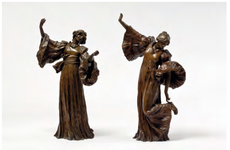
„CHANTEUSE“ UND „DANSEUSE“ AUS DEM TAFELAUFSATZ „LE JEU DE L'ÉCHARPE“, Agathon Léonard, Paris, um 1900