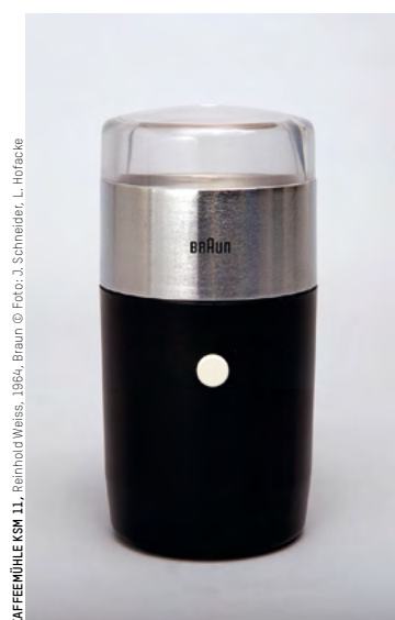
KAFFEEMÜHLE KSM 11, Reinhold Weiss, 1964, Braun