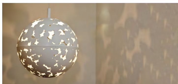
CAMOUFLAGE, Front Design, 2007

Der Neuzugang passt innerhalb der Sammlung hervorragend zu den Arbeiten der Künstlergruppe ZERO (z.B. Hermann Goepfert, Adolph Luther, Heinz Mack) sowie den Werken der Op Art (Victor Vasarely, Yaacov Agam) und überführt das Thema der optischen Farb- und Licht-Effekte mit LED-Technik in die Jetzt-Zeit.