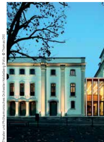
Theater und Philharmonisches Orchester Heidelberg