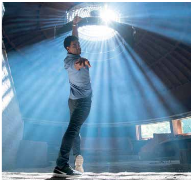
Filmstill YULI

Details zu Führungen und Rahmenprogramm siehe Vorderseite