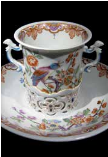
Trembleuse, Manufaktur du Paquier, Wien, um 1730, Sammlung des Fürstentums und zu Liechtenstein, Vaduz-Wien

Im 16. Jahrhundert brachten die Spanier Kakao nach Europa. Das Genussmittel fand rasch Verbreitung und avancierte zum Luxusgetränk des Adels. Zubereitet wurde es mit Wasser, verfeinert mit Rohrzucker oder Honig. Um dem kostbaren Trunk möglichst verlustfrei zusprechen zu können, erfand man zu Beginn des 18. Jahrhunderts die Trembleuse (Zittertässchen). Sie besteht aus einer Untertasse mit einem durchbrochenen, hochgezogenen Rand, in den ein Becher fest eingestellt wurde. So konnten die Adeligen Kakao auch im Bett zu sich nehmen – selbst das altersschwache Händchen brauchte auf den Genuss nicht verzichten.