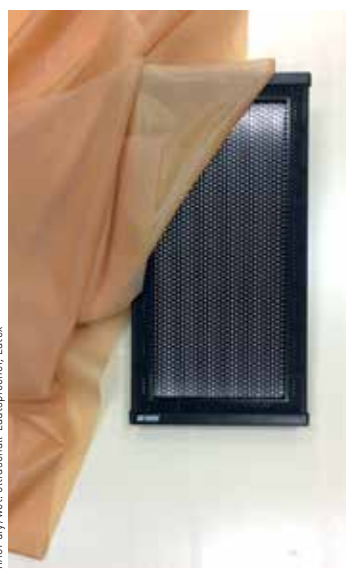
HAUT dry/wet. Ultraschall-Lautsprecher, Latex