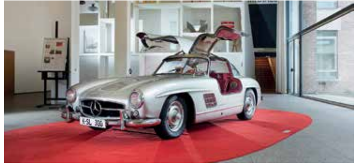
Mercedes-Benz SL 300 Gullwing, 1956

Freitag, 4. Mai, 19–22 Uhr / Opening Party bis 24 Uhr; Samstag, 5. Mai & Sonntag, 6. Mai, jeweils 10–19 Uhr | Eintritt € 5,- (inkl. „Peter Behrens“)