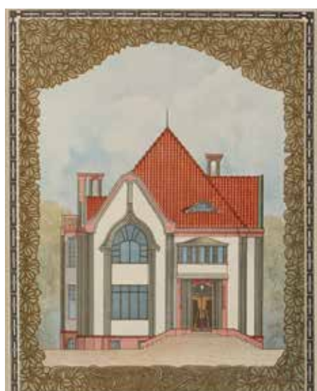
Nordfrassade des Hauses Behrens (Ausschnitt), 1901, in: Deutsche Kunst und Dekoration, Bd. IX, 1901/02

ÖFFENTLICHE FÜHRUNG #alleskönner. Peter Behrens zum 150. Geburtstag Museumsdienst Köln € 2,- zzgl. Eintritt in die Sonderausstellung