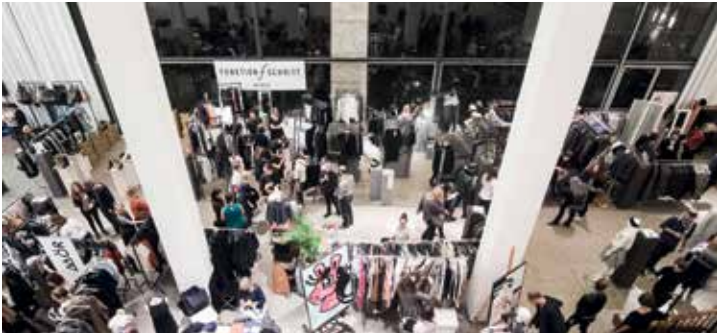
SUPER FASHION MARKT in der Halle des MAKK

Als künstlerischer Beirat der AEG gestaltete Peter Behrens ab 1907 deren gesamten Firmenauftritt – und verwirklichte damit Aspekte des Corporate Designs, bevor dieser Begriff überhaupt entstanden war. Aber nicht nur dies: Er entwarf Gebäude, wie die AEG-Turbinenhalle, und kümmerte sich um die Gestaltung der AEG-Produkte, wie die der elektrischen Tee- und Wasserkessel. Dazu wählte Behrens drei Grundformen (tropfenförmig, achteckig, oval), drei Materialien (Messing, verkupfertes Messing, vernickeltes Messing), drei Oberflächenstrukturen (glatt, flockig gehämmert, geflammt gehämmert) sowie drei Größen (0,75 l, 1,25 l, 1,75 l). Trotz des Variantenreichtums waren die Kessel ideal für die industrielle Massenproduktion, da sie zum einen auf einfachen Formen basierten, zum anderen Kleinteile – wie beispielsweise die Deckel – mit einer Maschineneinstellung hergestellt werden konnten.