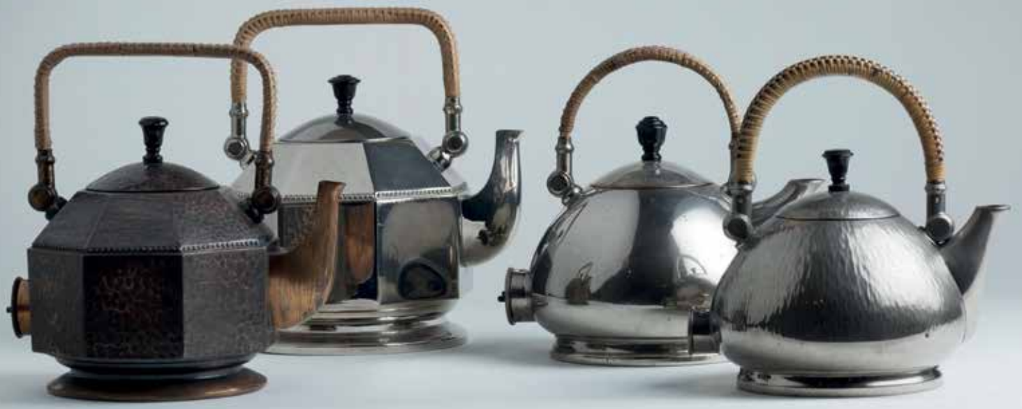
PETER BEHRENS, Elektrische Tee- und Wasserkessel, AEG Berlin, 1909