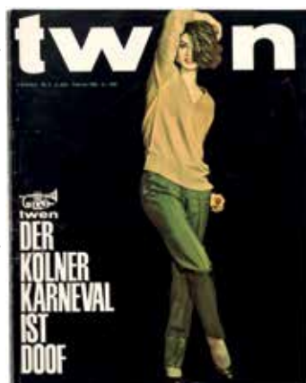
COVER twen Nr. 2, 1962, Fotografie: Christa Peters (Foto: © Hans Döring)