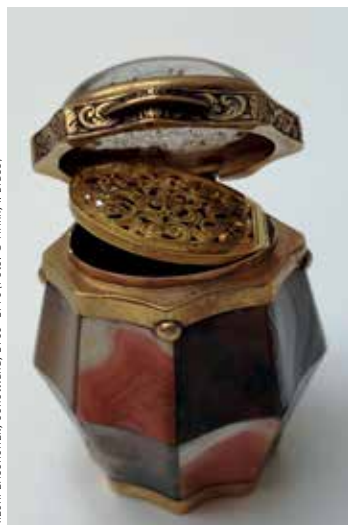
RIECHFLÄSCHCHEN, Schottland, 1750–1770

Als Gretchen in Goethes Faust von ihrer eigenen Tragödie überwältigt wird, stammelt sie nur noch Nachbarin! Ihr Fläschchen! , bevor sie in Ohnmacht fällt. Mit dem Fläschchen ist das besonders im 17. und 18. Jahrhundert bei der Damenwelt beliebte Riechfläschchen gemeint. In dem kleinen Gefäß befanden sich Riechsalze oder auf Riechsalzen basierende Flüssigkeiten, die häufig Ammoniak freisetzen. Dieses sollte einen verstärkten Atemreiz hervorrufen und so eine drohende Ohnmacht verhindern. In der modernen Ersten Hilfe hat das Riechsalz keine Bedeutung mehr.