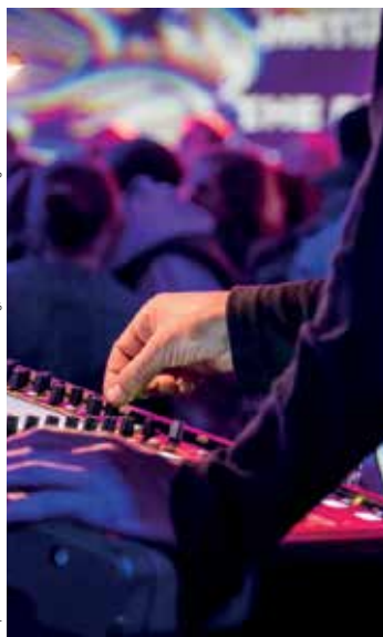
Impression Museumsnacht 2017