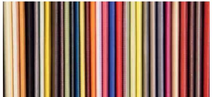
Ausstellungskataloge Fuhrwerkswaage