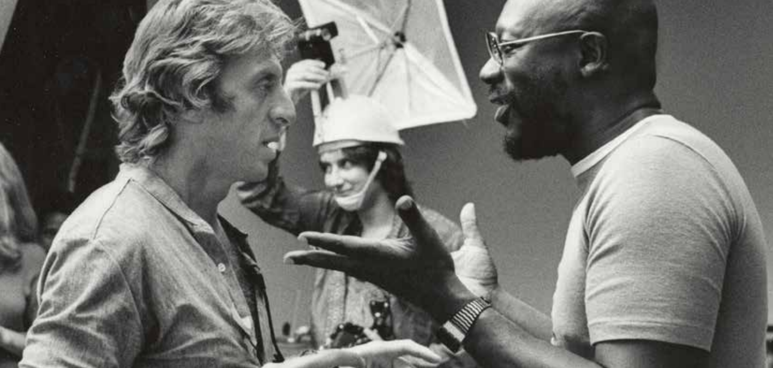
Norman Seeff, Isaac Hayes, 1977 © Norman Seeff