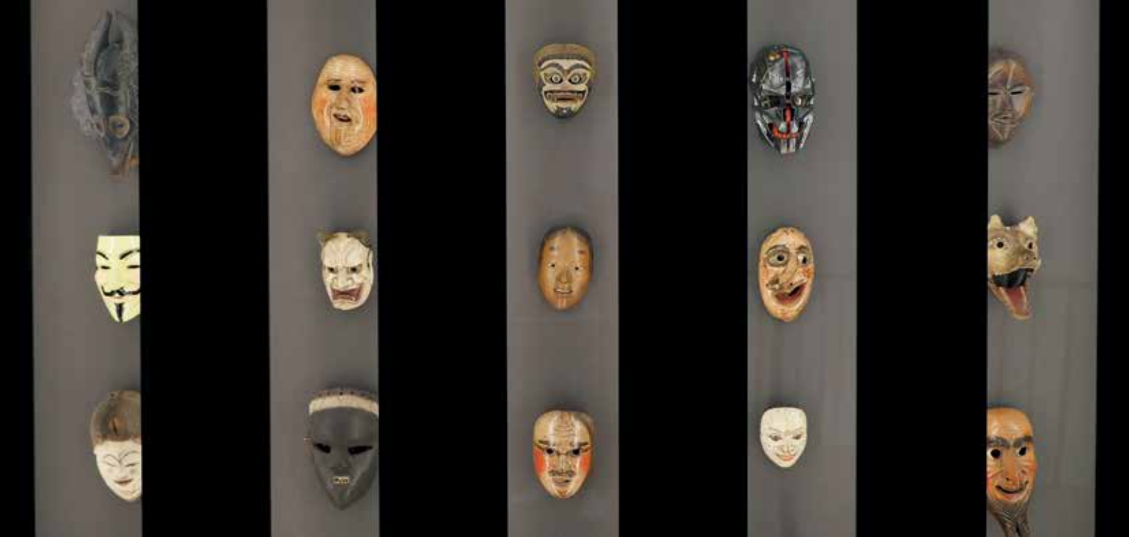
Installation mit Masken aus Ritual und Brauchtum in der Ausstellung „Im Spielrausch“, 16.-21. Jh. (Ausschnitt)