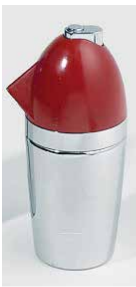
NORMAN BEL GEDDES, Siphon „Soda King“, Bloomfield, New Jersey (US), 1938