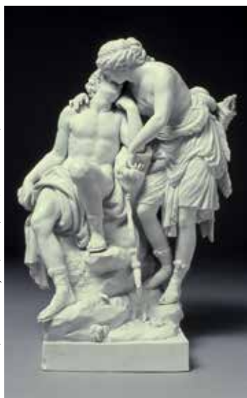
C. G. Jüchter, Diana und Encymion, Meissen, 1787

Samstag/Sonntag 7./8.10., jeweils 14.30 Uhr; Mittwoch 11.10., 11 Uhr