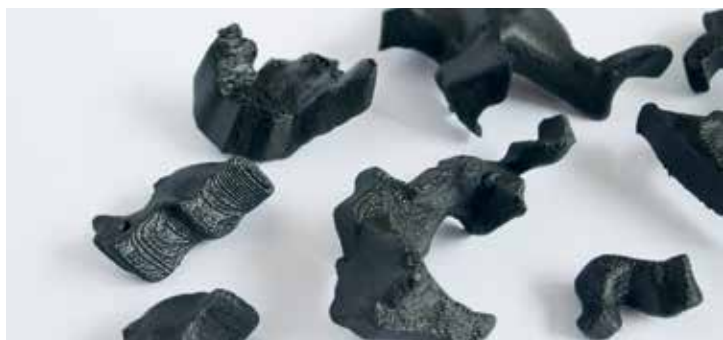
MAX PIETRO HOFFMANN, Means of Digital Images, 1. Preis 2016

Die Besucherinnen und Besucher der Spielrausch -Ausstellung werden von einer großen Vitrine empfangen, in der zahlreiche Masken aus unterschiedlichen Epochen und Kulturkreisen versammelt sind: von einer japanischen Maske aus dem 16. Jahrhundert bis hin zur Guy-Fawkes-Maske aus dem 21. Jahrhundert, die mittlerweile zum Symbol internationaler Protestbewegungen geworden ist. Masken bilden den Einstieg in die Ausstellung, da sie wie kein anderes Objekt für das Eintauchen sowohl in theatrale als auch virtuelle Welten stehen und auf Formen der Grenzüberschreitung zwischen realen und fiktionalen Welten verweisen. Der spannenden Frage nach dem Verhältnis zwischen Spiel und Kunst geht die erste Diskussionsrunde der Reihe Im Rederausch des Begleitprogramms nach. | Mittwoch, 25. Oktober, 18 Uhr