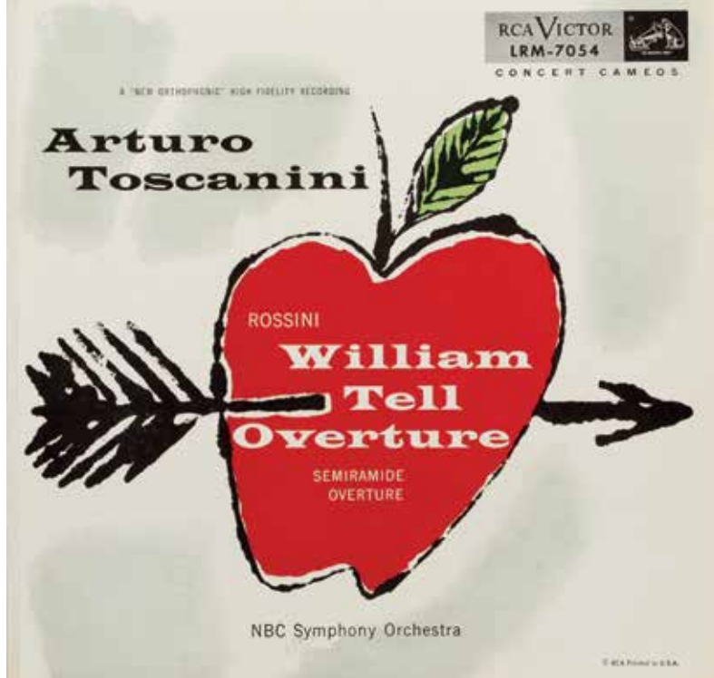
ANDY WARHOL, Plattencover „Gioacchino Rossini, William Tell Overture, Semiramide Overture“, 1954