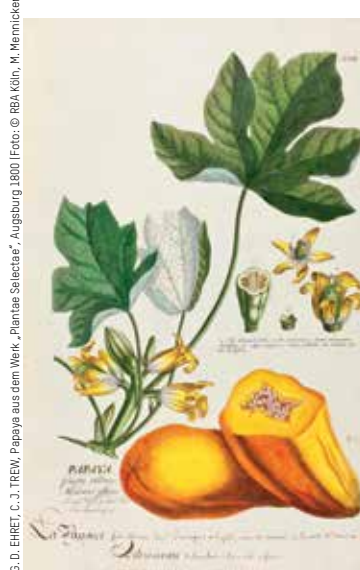
G. D. EHRET, C. J. TREW, Papaya aus dem Werk „Plantae Selectae“, Augsburg 1800