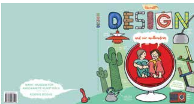
Cover des Designbuchs, Illustration: Birgit Jansen

Donnerstag, 4. Oktober, 18 Uhr | Eintritt € 3,-; frei für Overstolzen und Studierende