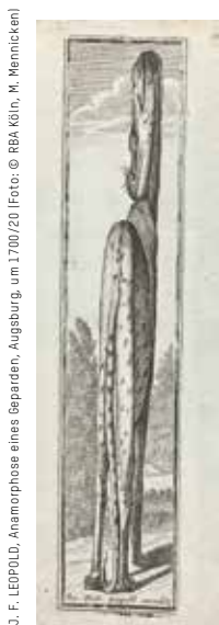
J. F. LEOPOLD, Anamorphose eines Beparden, Augsburg, um 1700/20

Bei einer Anamorphose handelt es sich um ein perspektivisches Zerrbild, das sich unter einem bestimmten Blickwinkel oder durch Zuhilfenahme eines Spiegels entschlüsseln lässt. Anamorphosen erfreuten sich ab der 2. Hälfte des 17. Jahrhunderts großer Beliebtheit als Scherzbilder oder auch um bildliche Botschaften zu verstecken. Das Wort kommt heute nur noch in den Kunst- und Kulturwissenschaften vor, findet aber im Alltag praktische Anwendung: So sind Verkehrszeichen, die direkt auf einer Fahrbahn aufgebracht sind, auf die Blickwinkel der Fahrer abgestimmt, also perspektivisch verzerrt.