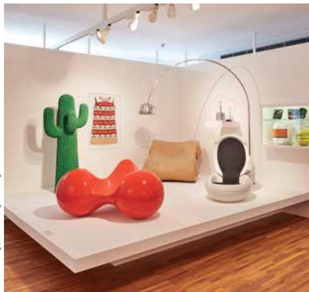
Dauerausstellung „Kunst + Design im Dialog“

KONZERT | PERFORMUSIK – ORBIT SCHÖNBERG Vorsicht hat noch nie einen Sieg errungen; Ungestüm schon oft! Streichquartette von Schönberg, Streich und Beethoven Asasello-Quartett Tickets bei KölnTicket | Weitere Informationen unter asasello-quartett.eu