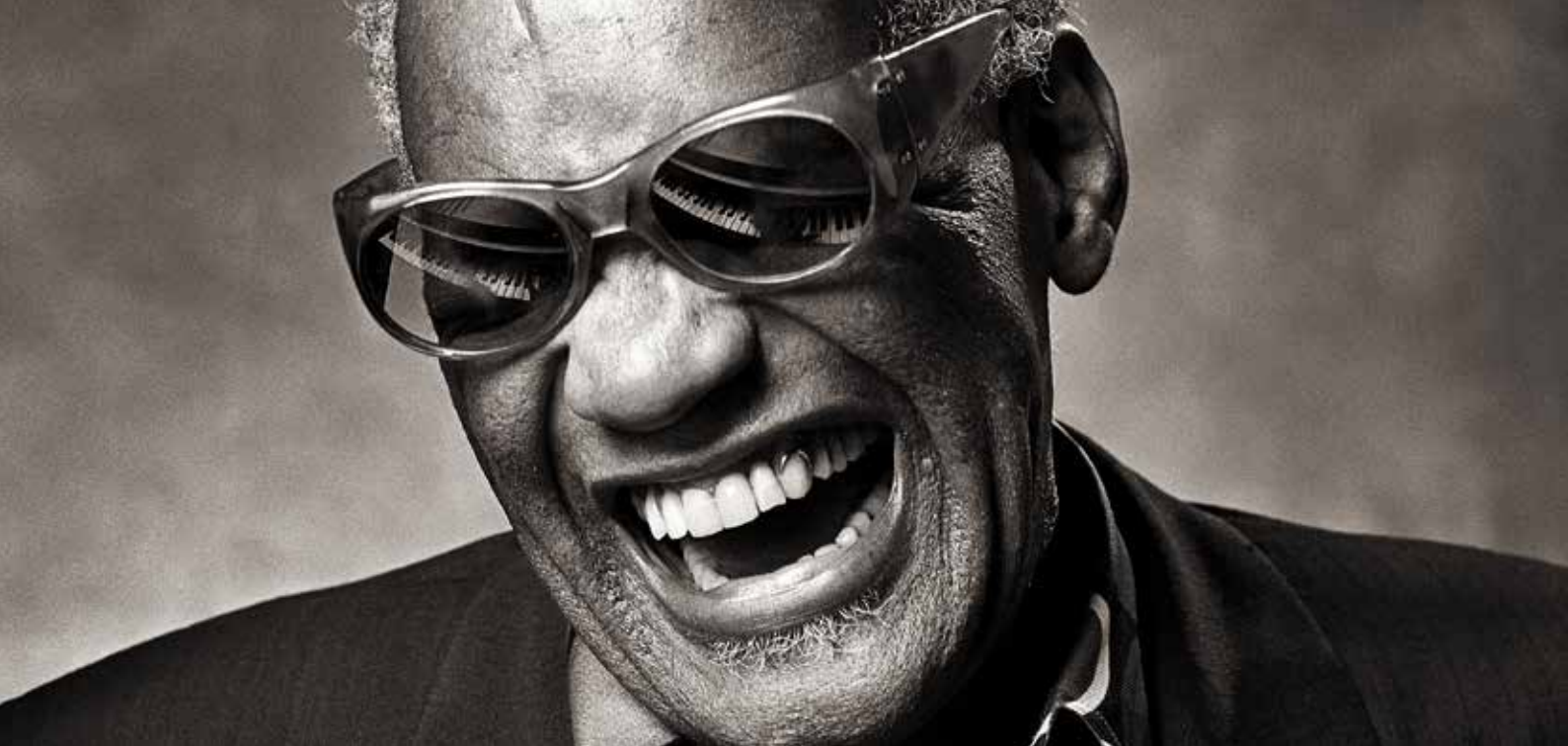
Ray Charles, 1985