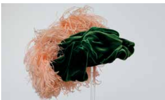
Grüne Samtkappe mit Marabufedern, Deutschland, um 1935