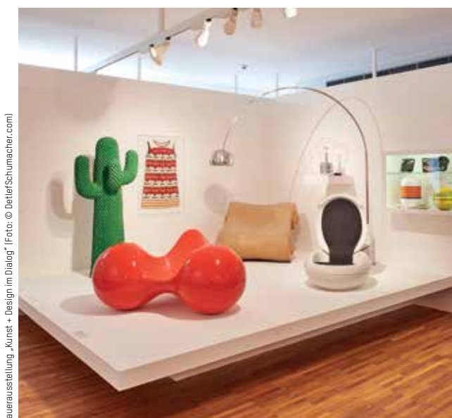
Dauerausstellung „Kunst + Design im Dialog“

Tickets bei KölnTicket | Weitere Informationen unter asasello-quartett.eu