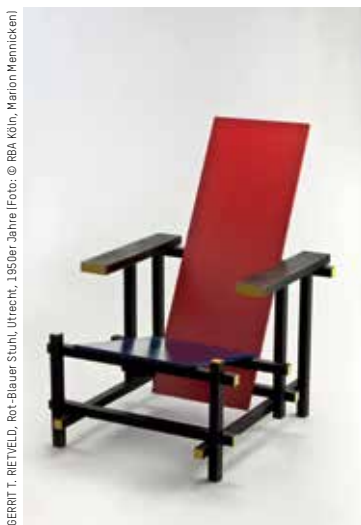
GERRIT T. RIETVELD, „Rot-Blauer Stuhl“, Utrecht, 1930er Jahre