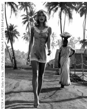
PETER H. FÜRST, „Baby in Goa“, 1974