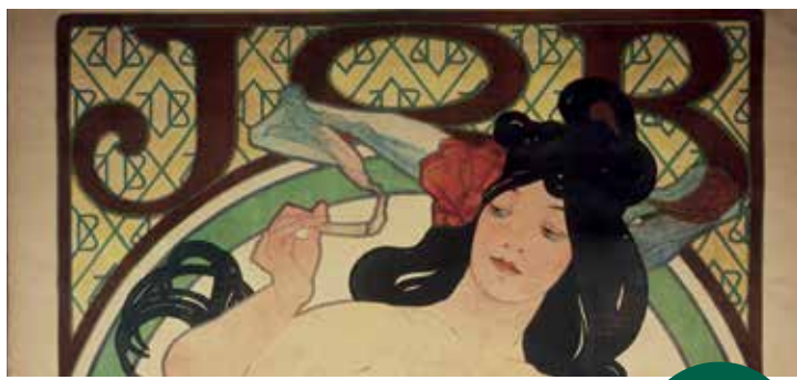
ALFONS MUCHA, Werbeplakat „JOB Zigarettenpapier“ (Detail), 1900

Wie alle zwei Jahre zur photokina, steht der September im MAKK wieder im Zeichen der Fotografie und des Festivals der Photoszene Köln. In der Design Lounge zeigt die Ausstellung Page Impressions vom 20.-25. September eine Auswahl von ca. 50 internationalen, gedruckten Fotomagazinen, die sich künstlerischer und dokumentarischer Fotografie widmen. Die Hefte werden als Independent-Magazine in eher kleiner Auflage produziert und sind zum größten Teil nicht im Buch- oder Zeitschriftenhandel erhältlich. Die Veranstaltung Photographer's Night gilt seit Jahren als ein besonderes Highlight des Festivals. Sie findet am 22. September statt und hat diesmal das Thema Ikonen der Flucht – Die neue Macht der Photographie . Dabei stehen die Flüchtlingsbewegungen der letzten zwei Jahre und die Rolle, die die Fotografie dabei spielte, im Mittelpunkt. Renommierete Fotografen, wie Daniel Etter, der 2016 den Pulitzerpreis erhalten hat, Sibylle Fendt und Nikos Pilos werden mit ihren Arbeiten vorgestellt. Karten und weitere Infos: photographersnight.de