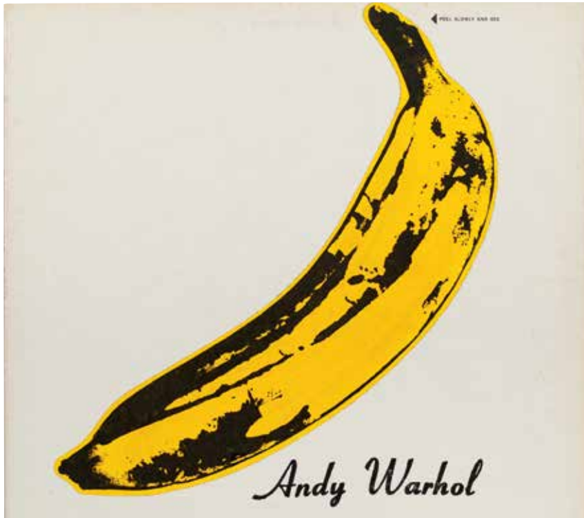
ANDY WARHOL, Plattencover „The Velvet Underground & Nico“, 1967