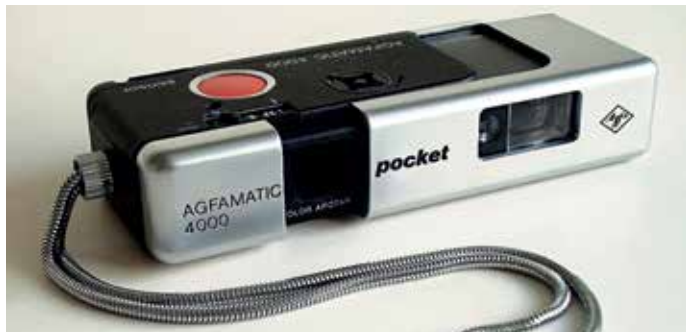
Agfatic Pocket 4000 Kamera

1968 schlägt im Design die Geburtsstunde zahlreicher Objekte, die heute als Designikonen gelten. Das italienische Designer-Trio Gatti, Paolini und Teodoro brachte den knautschigen Sitzsack „Sacco“ auf den Markt, die Brüder Bellini den knallbunten, tragbaren Plattenspieler „Phono Boy“, der die Größe einer Handtasche hat. Für eine weitere Ikone sorgte der gebürtige Ungar Peter Ghyczy: Er entwickelte aus glasfaserverstärktem Polyester die Schale eines innovativen Sessels für den Innen- und Außenbereich. Die Rückenlehne des drageeförmigen „Gartenei“ lässt sich herunterklappen, so dass das Polster gegebenenfalls vor Nässe geschützt ist.