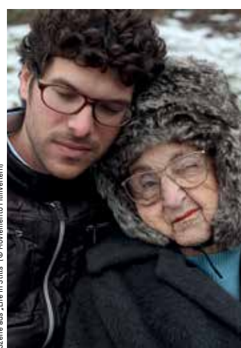
Szene aus „Life in Stills“