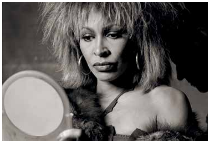
Tina Turner, 1983

Vernissage am Donnerstag, 12. September, 19 Uhr