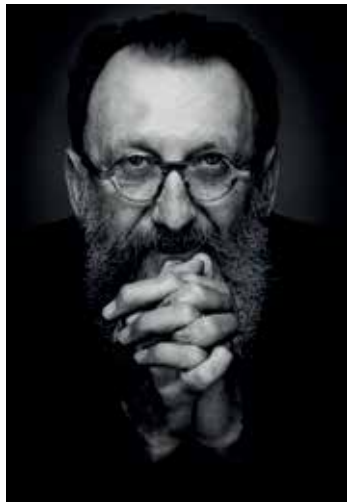
Michele De Lucchi | © bodur.com

Donnerstag, 19. September, 19 Uhr Anmeldung erforderlich; Details s. Vorderseite