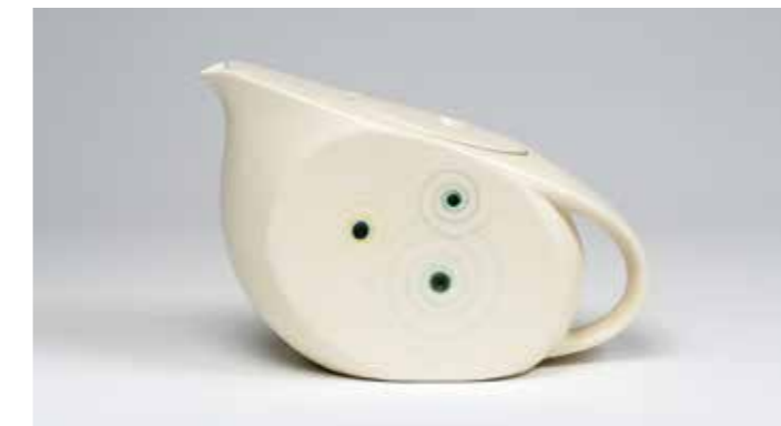
8 Teapot from the Bauhaus service , around 1929