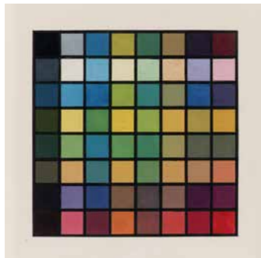
3 Karl Hermann Haupt, colour study, oil on canvas, Weimar, 1923