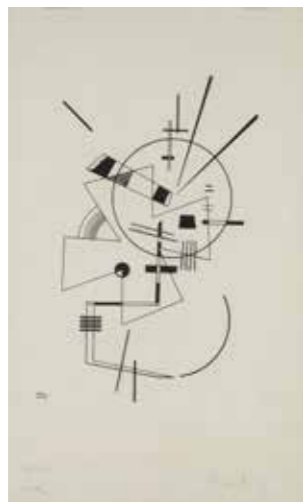
2 Wassily Kandinsky, lithography no. II, Weimar/Dessau, 1925