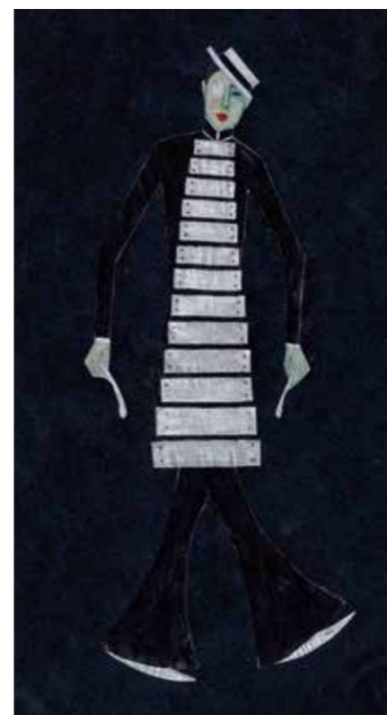
5 Le Xylophone. Costume pour un ballet , Mannheim, 1929