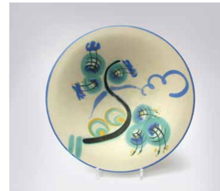
6 Fruit bowl, around 1930