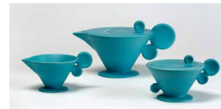
7 Parts of a tea service, around 1929