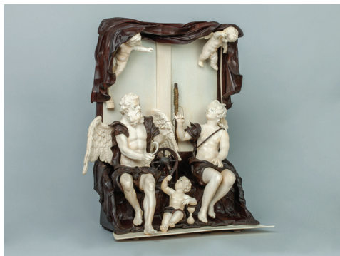
SIMON TROGER, Chronos und Klotho, München um 1750 (Foto: © Kunsthandel Peter Mühlbauer)

Do, 7.12., 19 Uhr, Details siehe Vorderseite