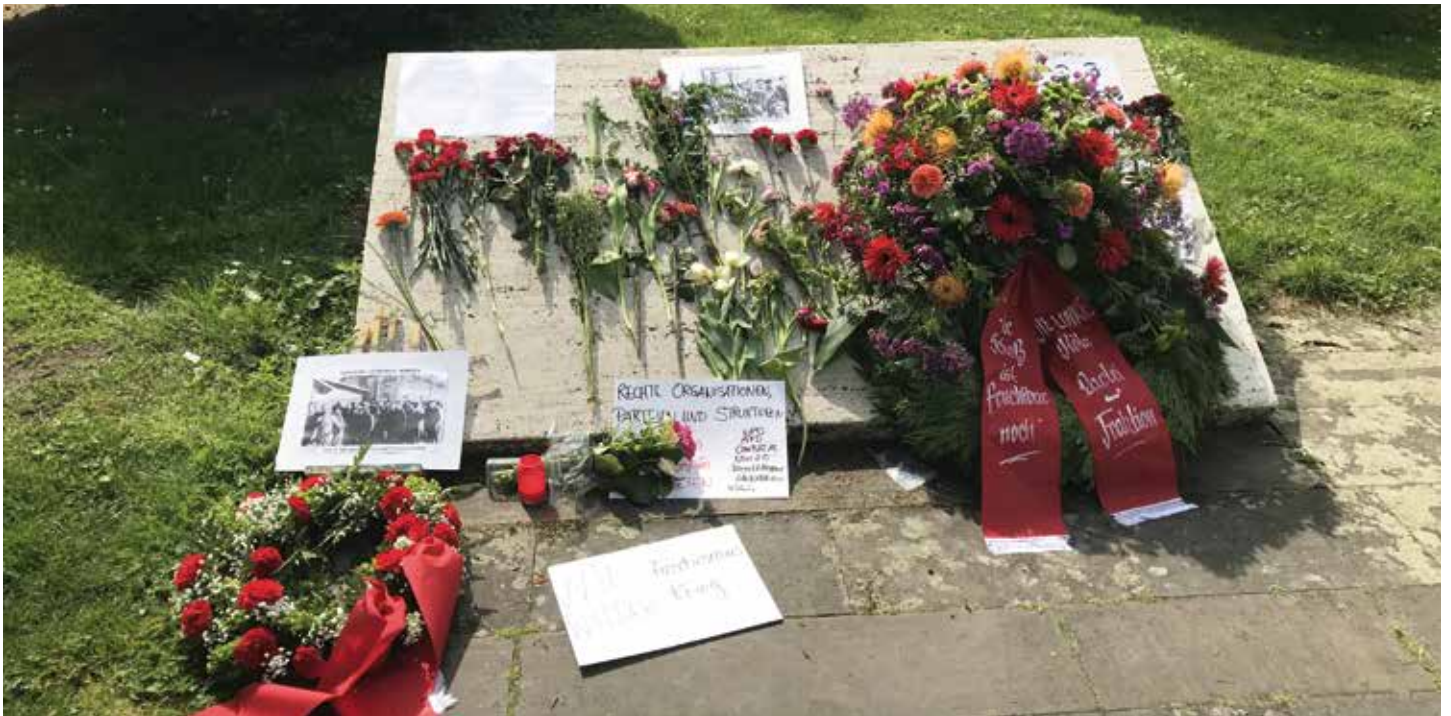
Am Mahnmal am Hansaring fanden sich den ganzen Tag über Gruppen und Einzelpersonen ein, um Blumen und Kränze niederzulegen und der Opfer des Faschismus zu gedenken.