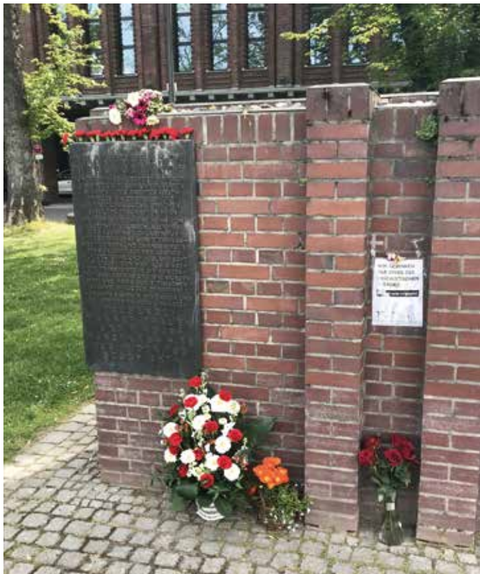
Messegebäude, Messengelände und der anschließende Bereich waren während des Zweiten Weltkrieges ein zentraler Ort der nationalsozialistischen Gewaltherrschaft in Köln. Hier befand sich auch ein Außenlager des KZ-Buchenwald.