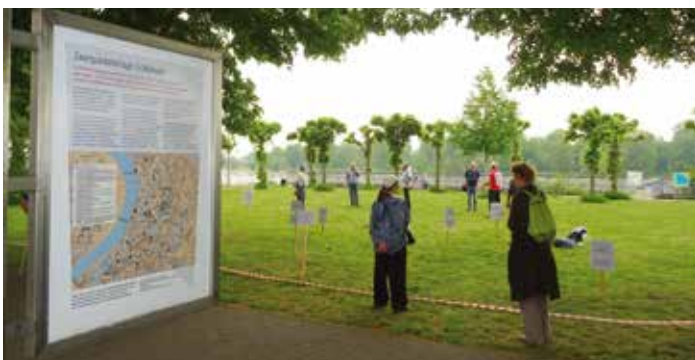
Am Mülheimer Rheinufer zwischen Schlackenbergrwerft und Düsseldorfer Straße befand sich ein Zwangsarbeiterlager der Firma Felten & Guillaume Carlswerk AG, ca. 650 Menschen – vor allem aus der Sowjetunion – wurden hier gefangen gehalten. Mitglieder von Kein Veedel für Rassismus Mülheim, der Nachbarschaft Köln Nord, der Geschichtswerkstatt Mülheim und der VVN erinnerten am 8. Mai an diesen Ort.