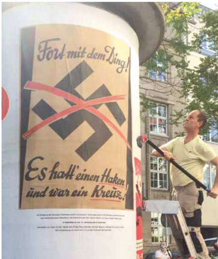
»Fort mit dem Ding!« Plakataktion zum 8. Mai, dem Kriegsende vor 75 Jahren