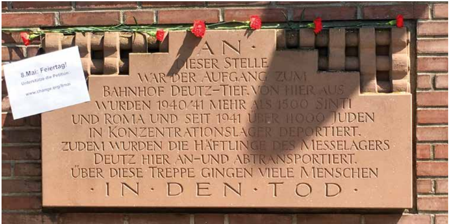
Vom Bahnhof Deutz aus gingen die Transporte in die Konzentrationslager. Tausende Männer, Frauen und Kinder wurden von hier aus in den Tod geschickt.