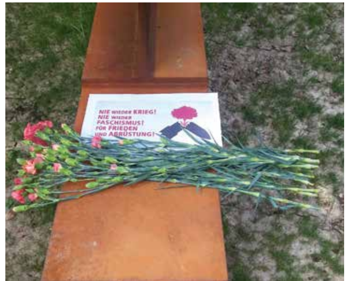
Blumen am Gedenkort an das Lager in Müngersdorf. Am neuen Gedenkort Deportationslager Müngersdorf lebt die Erinnerung. Blumen, Lichter und viele Steine, die jüdischem Ritus an die Toten erinnern, werden dort niedergelegt und die beeindruckende Gestaltung und der Weg der Erinnerung laden alle, die vorbei kommen oder radeln ein, sich zu informieren.