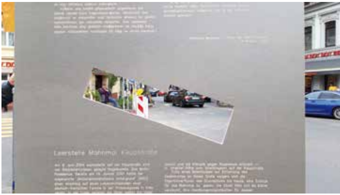
Ein Mahnmal mahnt und ermöglicht die Durchsicht zum Tatort.