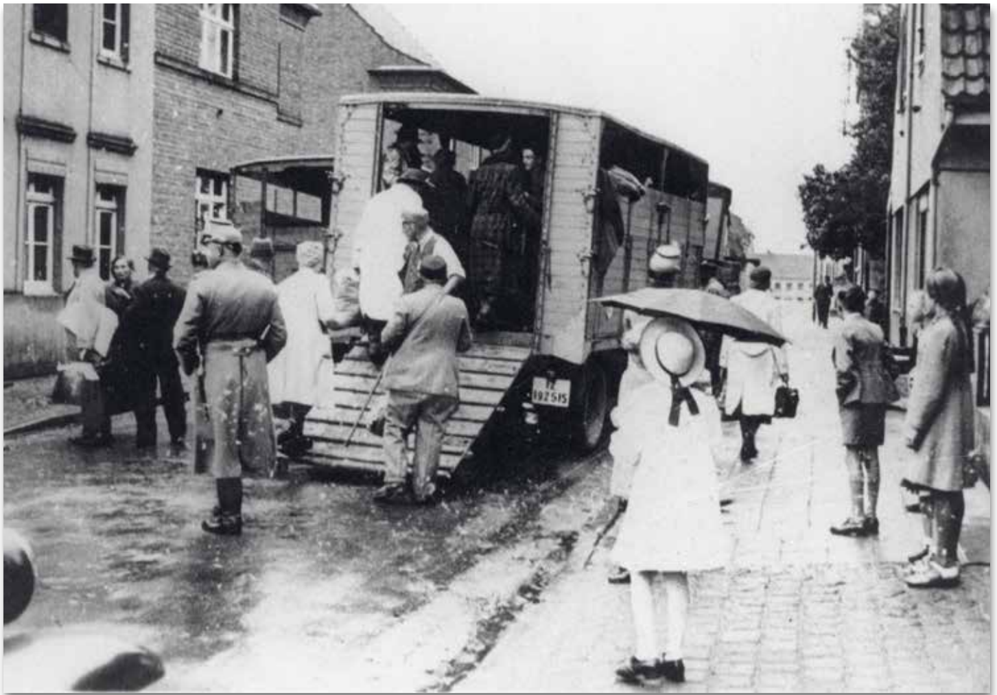
Schaulustige sehen zu, wie die Polizei Jüdinnen und Juden zur Deportation auf Lastwagen verlädt. Kerpen, Deutschland, 1942.

Donnerstag 12. November 2020, 19 Uhr Ausstellungseröffnung