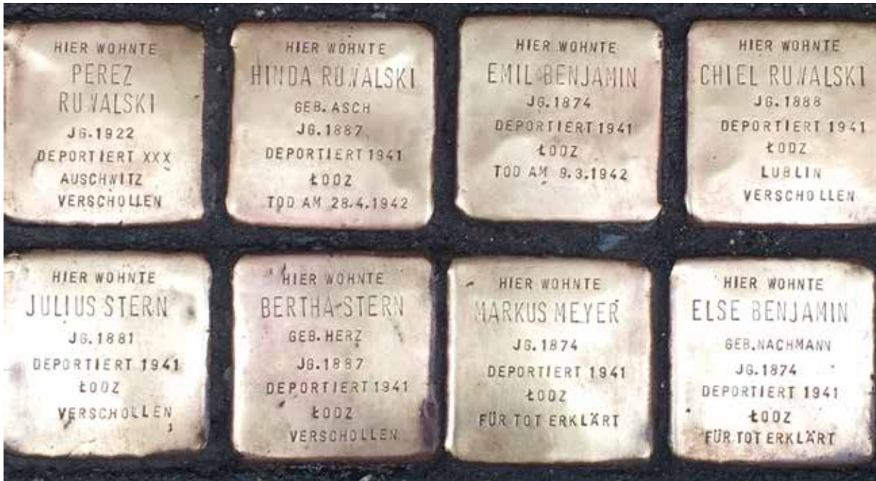
Die Stolpersteine in neuem Glanz

»Es kamen Selbsttötungen vor, weil die Menschen verzweifelt waren«, beschrieb Becker-Jákli. »Zugleich waren diese Häuser ja in der normalen Umwelt, der Alltagswelt der Kölner. Also nebenan war eben kein Ghettohaus, rechts und links waren keine Gethtohäuser. Und die Menschen nebenan lebten ganz – in Anführungsstrichen – normal.«