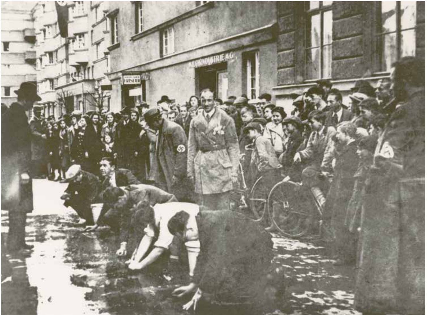
Jüdische Wiener werden im Rahmen der Anschlusspogrome gezwungen, politische Parolen von der Straße zu waschen. Wien, Österreich, März 1938