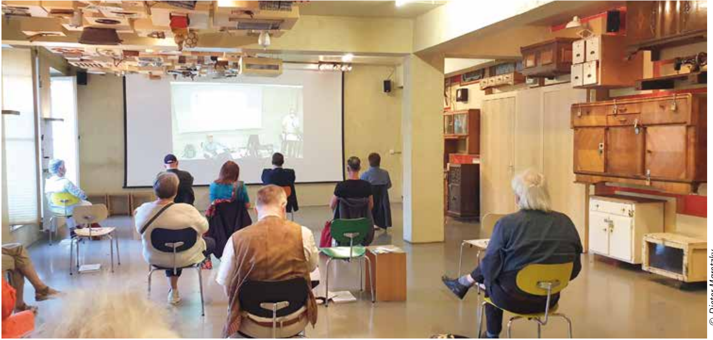
Mitgliederversammlung in zwei Räumen, bei offenen Fenstern, mit Abstand und Mund-Nasen-Schutz: Die Sicherheit unserer Mitglieder ist uns wichtig!