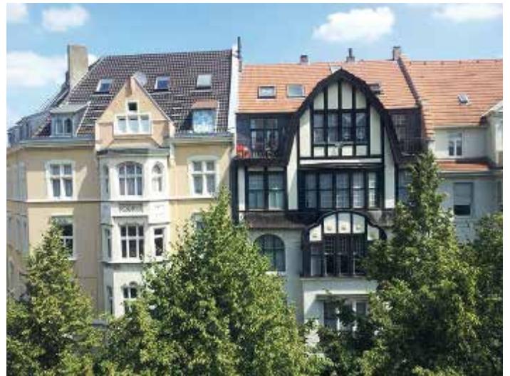
Die Aussicht aus Nr. 63, heute wie damals

Noch zögerte ich einige Wochen, fragte mich, wie weit ich gehen würde, um mehr über das Ghettohaus und seine ehemaligen Bewohner zu erfahren, versuchte zu verdrängen, was sich mit meinem neuen Zuhause verband. Mein Blick schweifte häufig über die dicht belaubten Alleebäume der Rolandstraße. Auf der gegenüberliegenden Straßenseite stehen noch heute historische Wohngebäude, entstanden um die Wende des 19. zum 20. Jahrhundert. Großbürgerlich geräumige Stadthäuser, fünf Etagen hoch, mit Außenstück verziert, Sprossenfenster, hohe Decken. Sicherlich teils während des Krieges zerstört, doch wieder restauriert, so, dass ich mir gut vorstellen kann, wie damals, 1940/41 die Menschen im Ghettohaus aus dem Fenster schauten – und in etwa das Gleiche sahen wie ich heute. Nur, sie blickten ängstlich, bangten damals um ihr Leben.