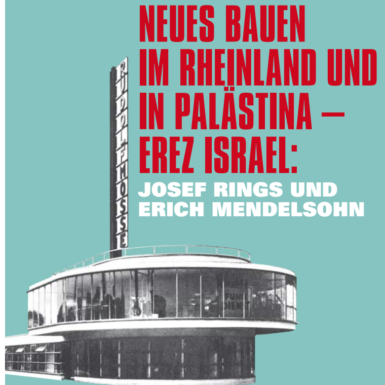
Rudolf-Mosse-Pavillon in Köln. Aus dem Buch: Pressa – Kulturschau am Rhein, Berlin 1928 © unbekannt