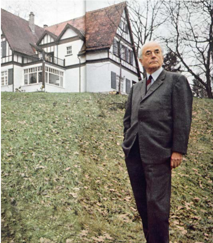
Albert Speer vor seiner Villa in Heidelberg, 1971