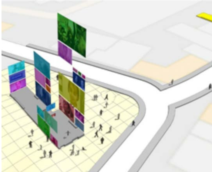
Entwurf des Mahnmals von Ulf Aminde © Ulf Aminde