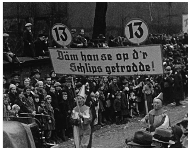
Kölner Rosenmontagszug 1936

Die Filmaufnahmen in Köln zeigen das Dreigestirn vor dem Rathaus, winkende Menschenmassen am Straßenrand und fantasievoll kostümierte Fußgruppen. Erstmals ist in bewegten Bildern der antisemitische Mottowagen zu sehen, der direkt