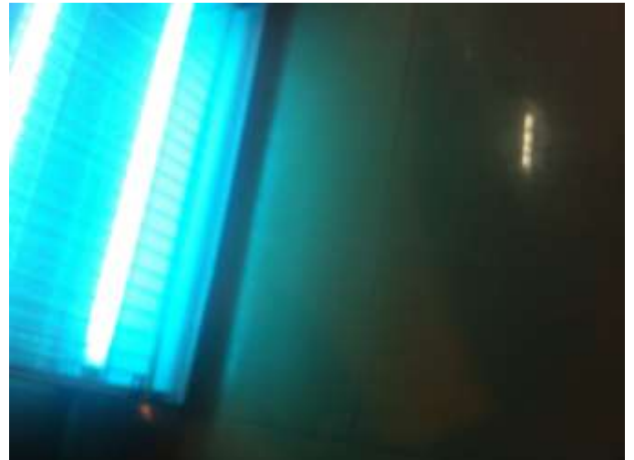
„Verstummt“ © Bettina Wenzel

Konzept / Stimm-Klangkomposition: Bettina Wenzel Fieldrecordings / Elektronik: Eva Poepplein E-Bass: Janko Hanushevsky