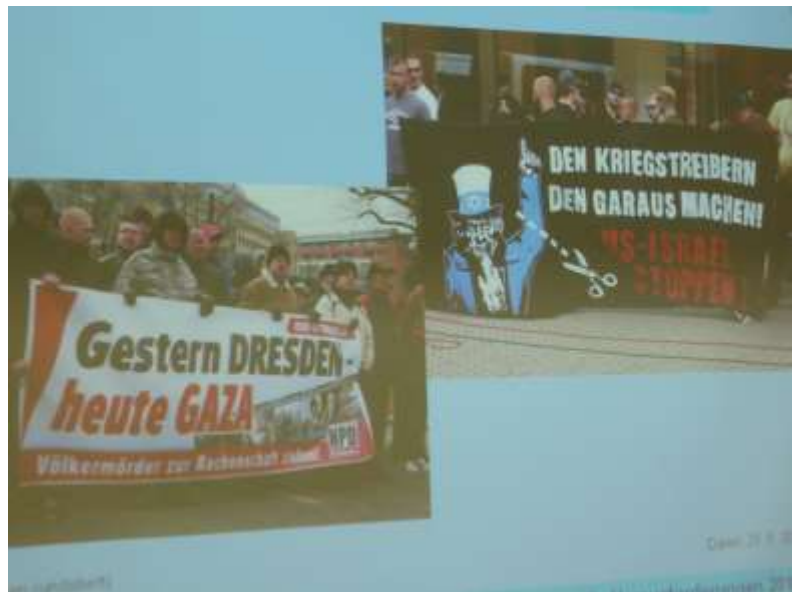
Aus der Präsentation von G. Botsch

Cocktail vergleichbar, der mit beliebig vielen oder unterschiedlichen Stereotypen gefüllt werden könne: Ältere Schichten der Judenfeindschaft tauchen ab und an wieder auf und werden mit neuen ergänzt, z.B. mit der sog. Auschwitz-Lüge als Spitze des Eisbergs; oder der Forderung, es müsse doch mal ein Schlussstrich gezogen werden, oder die Gleichsetzung „der Juden“ mit der Politik des Staates Israel oder diverser Verschwörungstheorien. Beispielsweise dass die gesamte Weltwirtschaft oder auch die Unterhaltungsindustrie in Hollywood von „den“ Juden beherrscht und gelenkt werde.