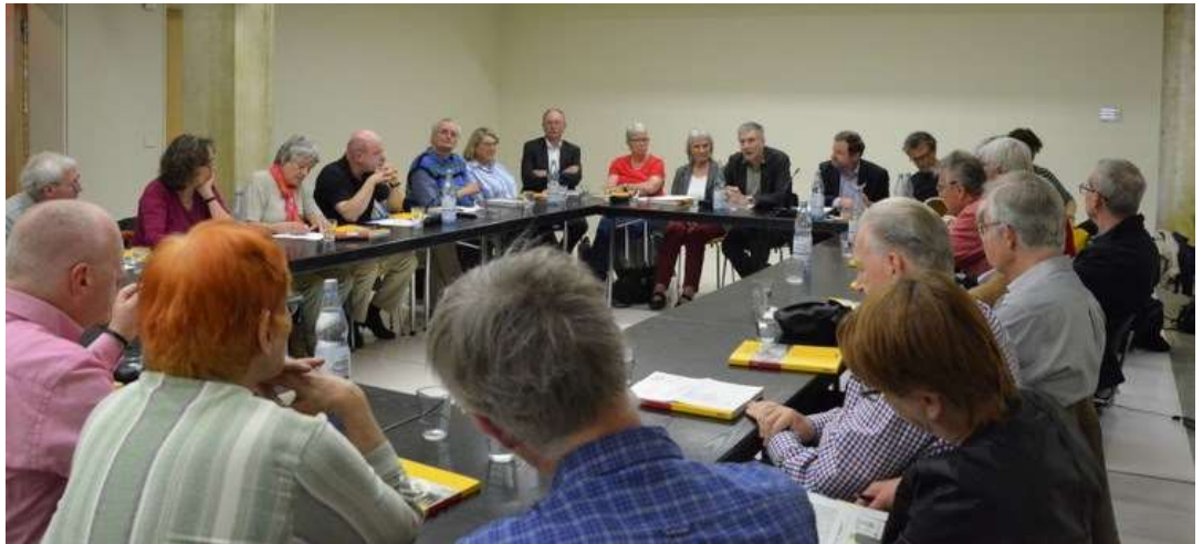
Mitgliederversammlung 2015