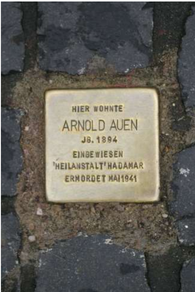
Stolperstein in der Kupfergasse 4

In Zusammenarbeit mit dem Kompetenzzentrum Selbstbestimmtes Leben Rheinland, Köln, und dem Friedensbildungswerk Köln (FBK)