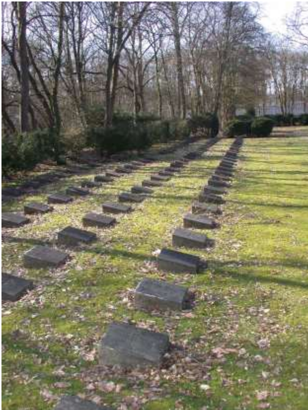
Gräberfeld Euthanasieopfer

Keine Führungsgebühr, Voranmeldung erbeten unter nsdok@stadt-koeln.de oder 0221/221-26332