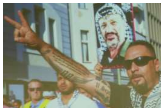
Aus der Präsentation von G. Botsch © Ciler Firtina

Im Auftrag und in Abstimmung mit dem gesamten Vorstand des Fördervereins wurde diese Vortrags- und Diskussionsreihe erstellt von Walla Blümcke, Ciler Firtina, Willi Reiter und Hajo Leib.