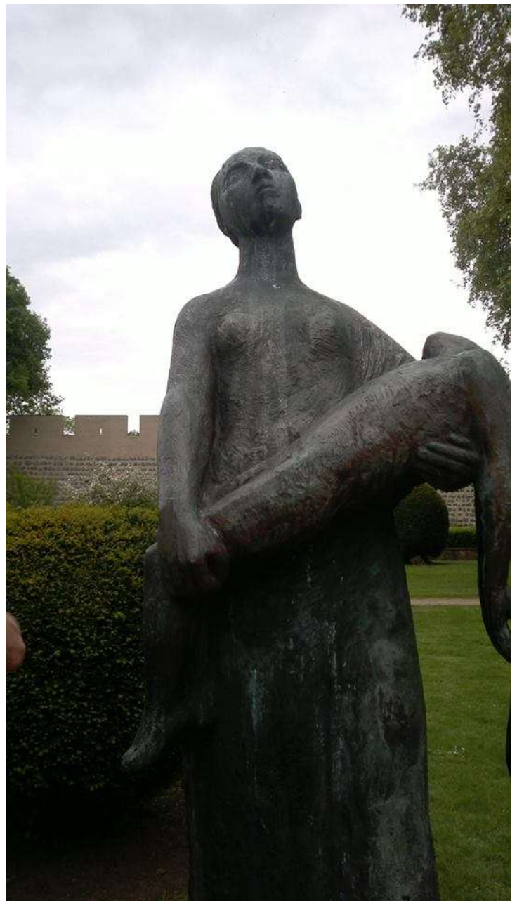
Statue „Mutter und Kind“ am Denkmal für die Opfer der Gestapo am Hansaring