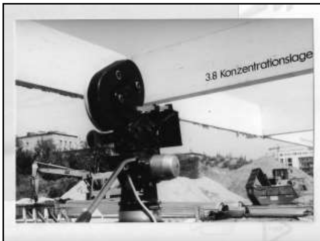
Gelände Photo 3