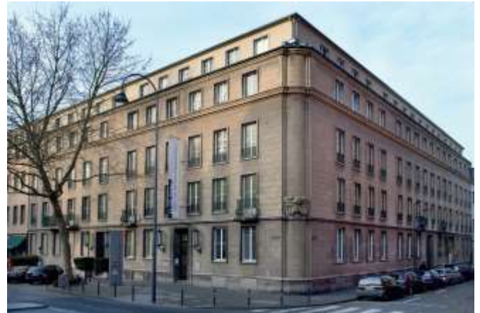
Außenansicht des EL-DE-Hauses

Das EL-DE-Haus wurde 1934/35 ursprünglich als Wohn- und Geschäftshaus errichtet. Im Sommer 1935 mietete die Gestapo das Gebäude an und ließ es für ihre Zwecke umbauen. Die Staatspolizei Köln arbeitete vom 1. Dezember 1935 bis zum 2. März 1945 in diesen Räumen. Die Baugeschichte des EL-DE-Hauses und die Nutzung durch die Gestapo stehen im Zentrum der Führungen. Vor allem im Gestapo-Gefängnis mit den Wandinschriften der Inhaftierten wird deutlich, welche Aussagekraft dieses »unbequeme Denkmal« hat und wie wichtig es für eine Gesellschaft ist, auch die »dunklen« Seiten der Geschichte wahrzunehmen.