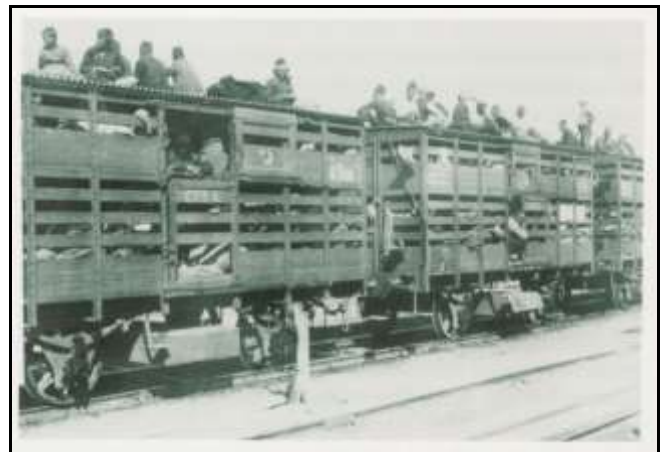
Bagdad-Bahn