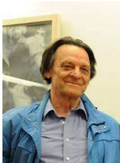
Kurt Holl © Privat

Die Duldung solcher Hetze vor allem durch die Justiz mache solche Anschläge erst hoffähig. Die Richterin lehnte eine Einstellung des Verfahrens gegen mich ab und will jetzt Zeugen für meine Beteiligung aufbieten. Der Prozess ist jetzt auf Spätherbst vertagt. Immerhin sagte das Gericht zu, einen größeren Saal bereitzustellen.