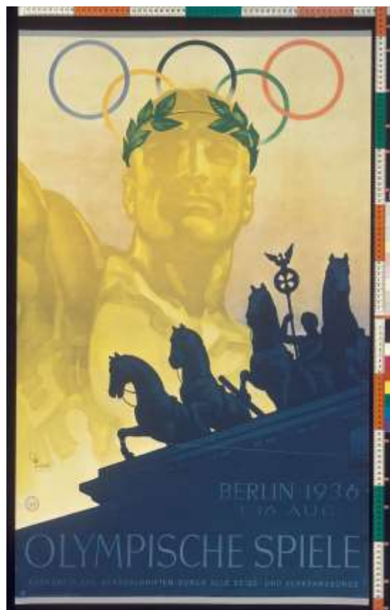
Plakat „Olympische Spiele 1936“

Voranmeldung erbeten unter nsdok@stadt-koeln.de oder 0221/221-26332 (beschränkte Teilnehmerzahl)