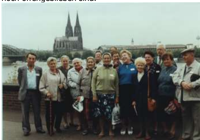
Besuchergroupe von September 1995

Für eine Woche erlebten sie neu – eine Stadt, in die sie verschleppt wurden, in der sie eingesperrt schwerste Arbeit unter unwürdigen Bedingungen verrichten mussten, in der sie gelitten und gehofft haben. Die Ausstellung lädt ein, die Geschichte des Besuchsprogramms von seinen Anfängen bis heute zu erleben, die Trauer und die Freuden der Betroffenen, und zu erfahren, wie viele Fragen noch offengeblieben sind.