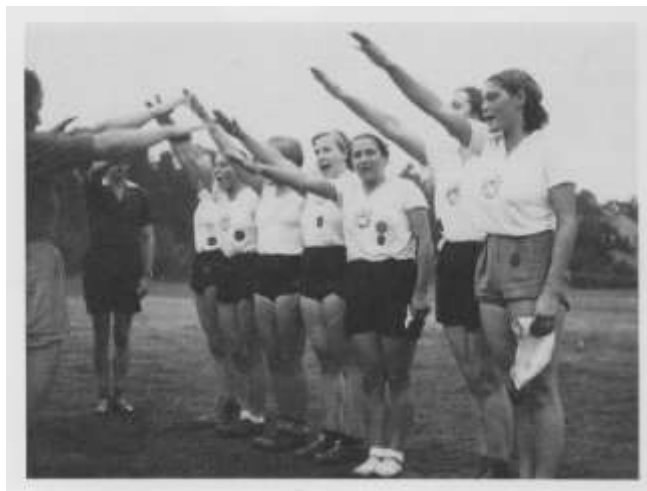
Korfball-Mannschaft der KT 1843 vor einem Spiel 1938

Sport war für die weltanschaulichen Grundlagen des Nationalsozialismus in mehrfacher Hinsicht von besonderer Bedeutung. Leibesübungen und körperliche Ertüchtigung waren der Grundpfeiler des nationalsozialistischen Erziehungsprogramms, vor allem im Hinblick auf die »Wehrhaftigkeit« und das spätere Soldatentum. Der gesunde und sportlich trainierte Körper wirkte zudem im Rahmen der Rassenlehre als Auslesekriterium.