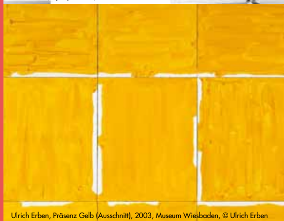
Ulrich Erben, Präsenz Gelb (Ausschnitt), 2003, Museum Wiesbaden, © Ulrich Erben