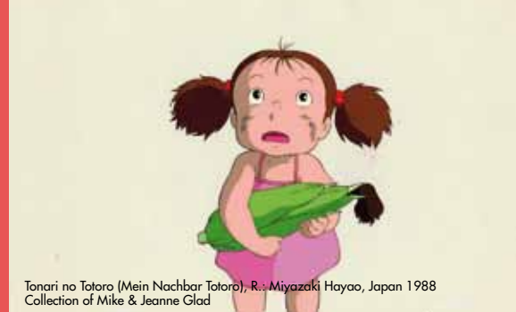
Tonari no Totoro (Mein Nachbar Totoro), R.: Miyazaki Hayao, Japan 1988