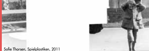
Sofie Thorsen, Spielplastiken, 2011