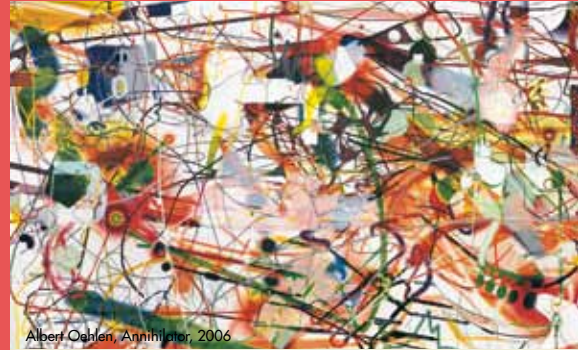
Albert Oehlen, Annihilator, 2006