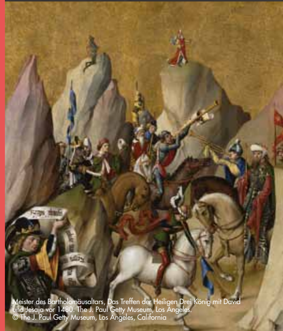
Meister des Bartholomäusaltars, Das Treffen der Heiligen Drei Könige mit David und Jesaja vor 1480. The J. Paul Getty Museum, Los Angeles.