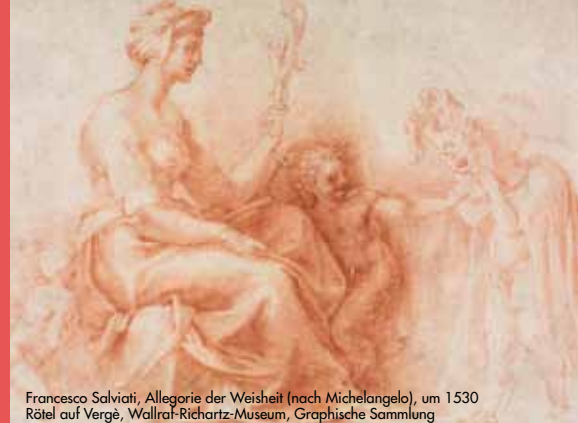
Francesco Salviati, Allegorie der Weisheit (nach Michelangelo), um 1530 Rötel auf Vergé, Wallraf-Richartz-Museum, Graphische Sammlung