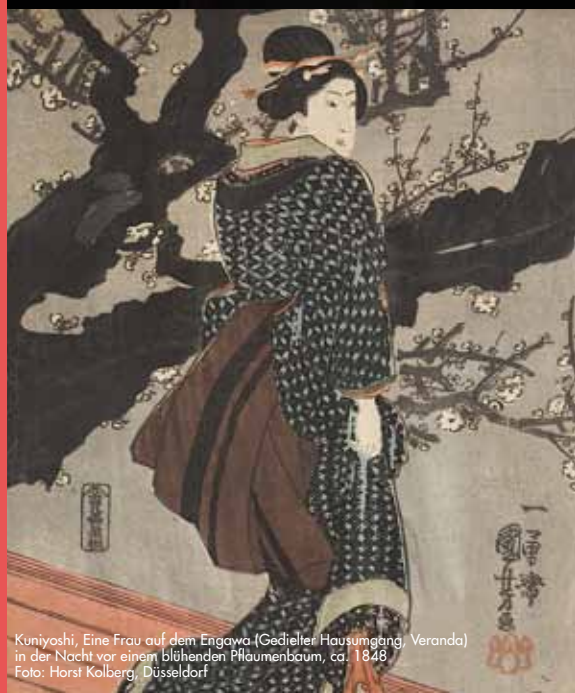
Kuniyoshi, Eine Frau auf dem Engawa (Gediehlter Hausumgang, Veranda) in der Nacht vor einem blühenden Pflaumenbaum, ca. 1848