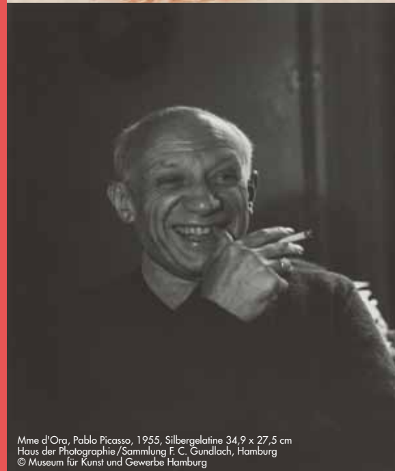
Mme d'Orá, Pablo Picasso, 1955, Silbergelatine 34,9 x 27,5 cm