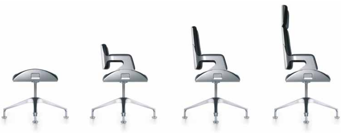
HADI TEHERANI, BÜROSTUHLSERIE ‚SILVER 262S‘ 2003, Meßstetten-Tieringen (D), © Interstuhl