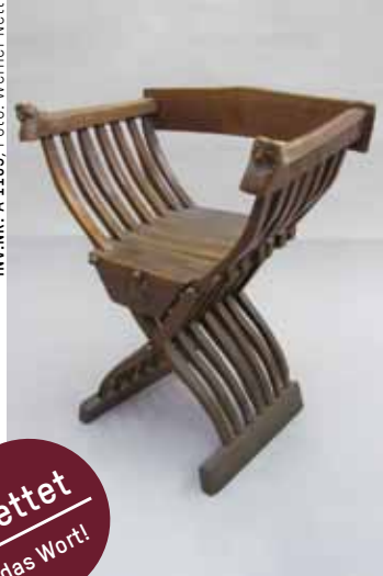
INV.NR. A 1105