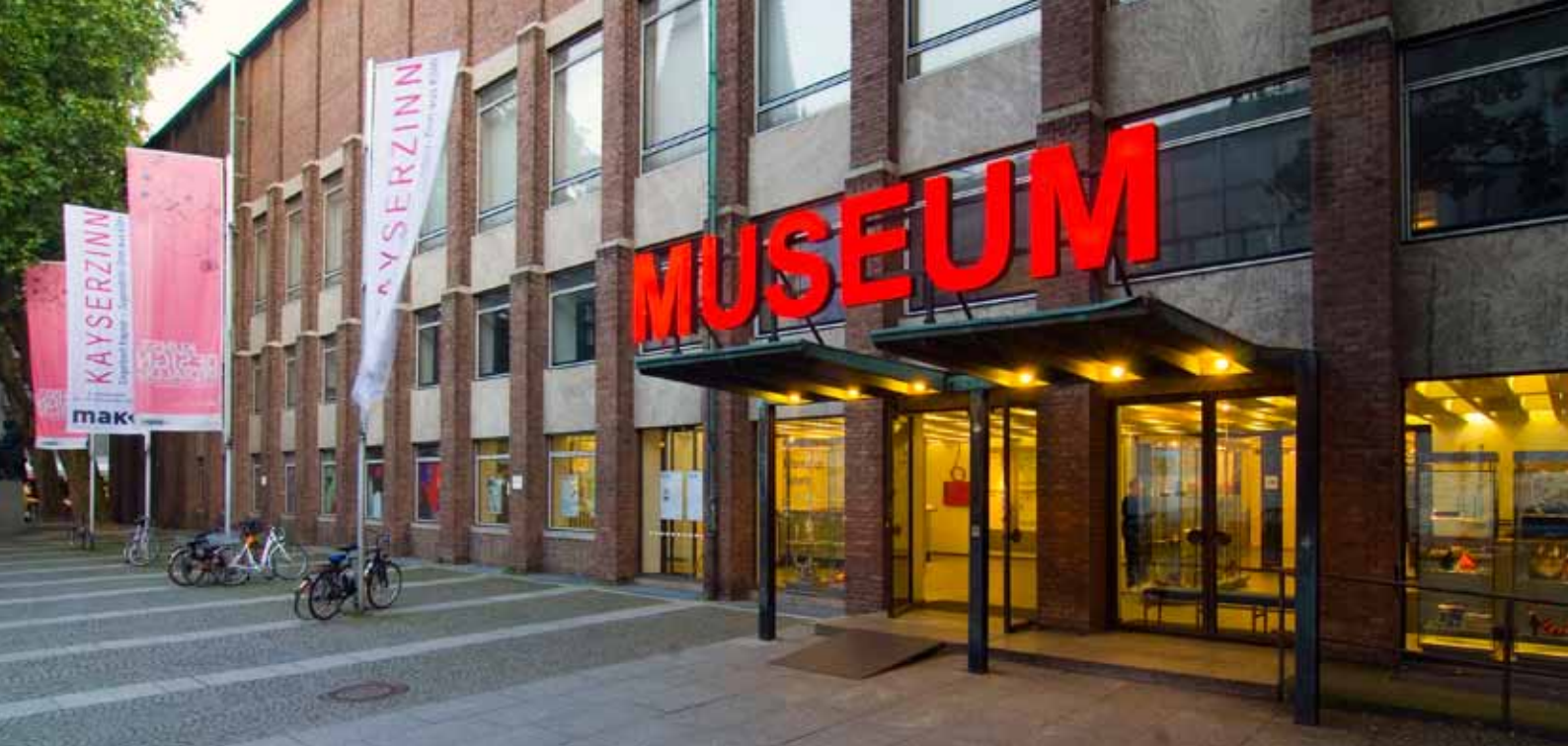
FASSADE MAKK