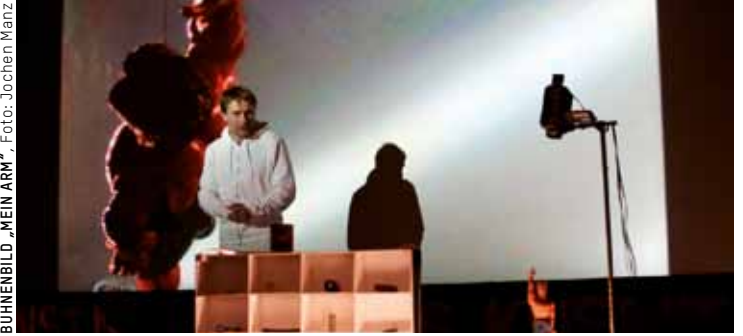
BÜHNENBILD „MEIN ARM“, Foto: Jochen Manz

Am 1. Sonntag im Monat gibt es bei uns die leckere Verbindung von Kunst + Frühstück. Das MAKK öffnet für Sie bereits um 10 Uhr und bis 14 Uhr haben Sie Gelegenheit, im Café Holtmann's zu Sonderpreisen zu frühstücken. Damit Ihnen und Ihrer Familie der Gesprächsstoff nicht ausgeht, bieten wir um 11 Uhr je eine Führung für Kinder und Erwachsene an – für die Kinder geht es diesmal um Karneval und die Erwachsenen besuchen die Ausstellung WASA MARJANOV . Es darf geschmunzelt werden! Sonntag, 5. Februar 2012, 11 Uhr