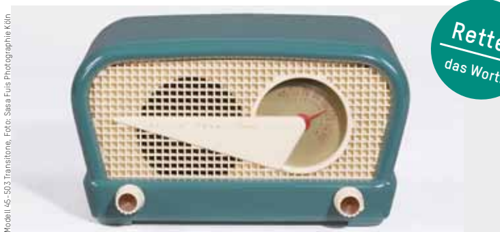
Modell 45-503 Transstone, Foto: Sasa Fujs Photographie Köln

Donnerstag, 1. März, und Donnerstag, 22. März, jeweils 18 Uhr