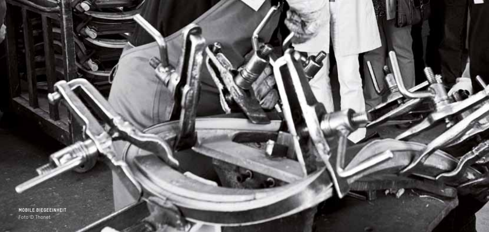
MOBILE BIEGEEINHEIT