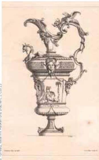
B. Turreau, Vase mit Masken und Drachen, 1710/15