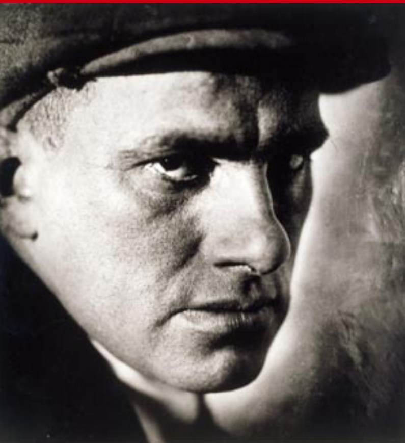
Abram Schterenberg Der Schriftsteller Wladimir Majakowskij, 1919 Vladimir Maiakowskij, poet, Moscow 1919

„Wir sind verpflichtet zu experimentieren!“ erklärte Aleksandr Rodtschenko 1924, um die großen Aufgaben der Fotografie für die Gestaltung des neuen gesellschaftlichen Lebens der Sowjetunion darzulegen und Taten anzumahnen. Viele Fotografen folgten seinem Beispiel einer resoluten Abkehr von den klassischen Traditionen hin zu einer medien-spezifischen Bildsprache für die revolutionäre Umgestaltung Russlands zur Sowjetunion. Sie wählten ungewohnte Bildausschnitte, arbeiteten mit extremen Perspektiven und entdeckten ‚neue‘ Motive beim industriellen Aufbau des Landes, im Großstadtleben und bei den vielen ethnischen Volksgruppen der Sowjetunion.