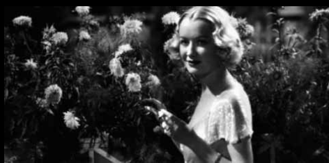
Design for Living

Ben Hechts (Buch) und Lubitschs sehr freie und freizügige Version des erfolgreichen Boulevard-Stücks von Noël Coward. Während Cowards Helden elegante und zynische Yuppies sind, setzen Hecht und Lubitsch auf mittellose, sympathische Bohemiens. Der Künstler George (Cooper) und der Stückeschreiber Tom (March) hausen in Paris