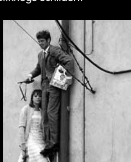
Pierrot le fou

Während Murger betont, Bohemiens seien weder „Gauner“ noch „Meuchelmörder“, sind sie bei Godard von Anfang an halb kriminell. Diebstahl, Entführung, Erpressung sind sie nicht völlig abgeneigt und obwohl Intellektuelle, verfügen sie meist über eine harte Rechte. In diesem Film scheint es zunächst anders zu sein. Der Aussteiger Pierre-Louis-Ferdinand (Belmondo), genannt Pierrot (Spatz), entdeckt mit seiner Geliebten, Marianne (Karina), eine Leiche und Waffen in der Wohnung ihres Bruders. Sie fliehen, werden von Gangstern verfolgt. Doch am Ende stellt sich heraus, dass Marianne tiefer in das Verbrechen verstrickt ist, als es den Anschein hatte. Der Film steckt voller Anspielungen auf den Schriftsteller Louis-Ferdinand Céline, der in seinen Romanen u.a. die Bohème während des Ersten Weltkriegs schildert.